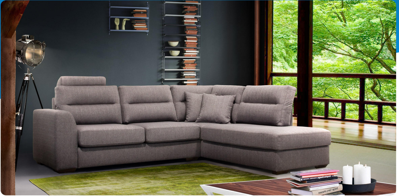
Base + assise + dossier Havana 16 - Base + seat + back Havana 16